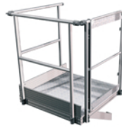
PALIER SORTIE LATÉRALE