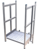
PALIER PASSAGE ACROTÈRE